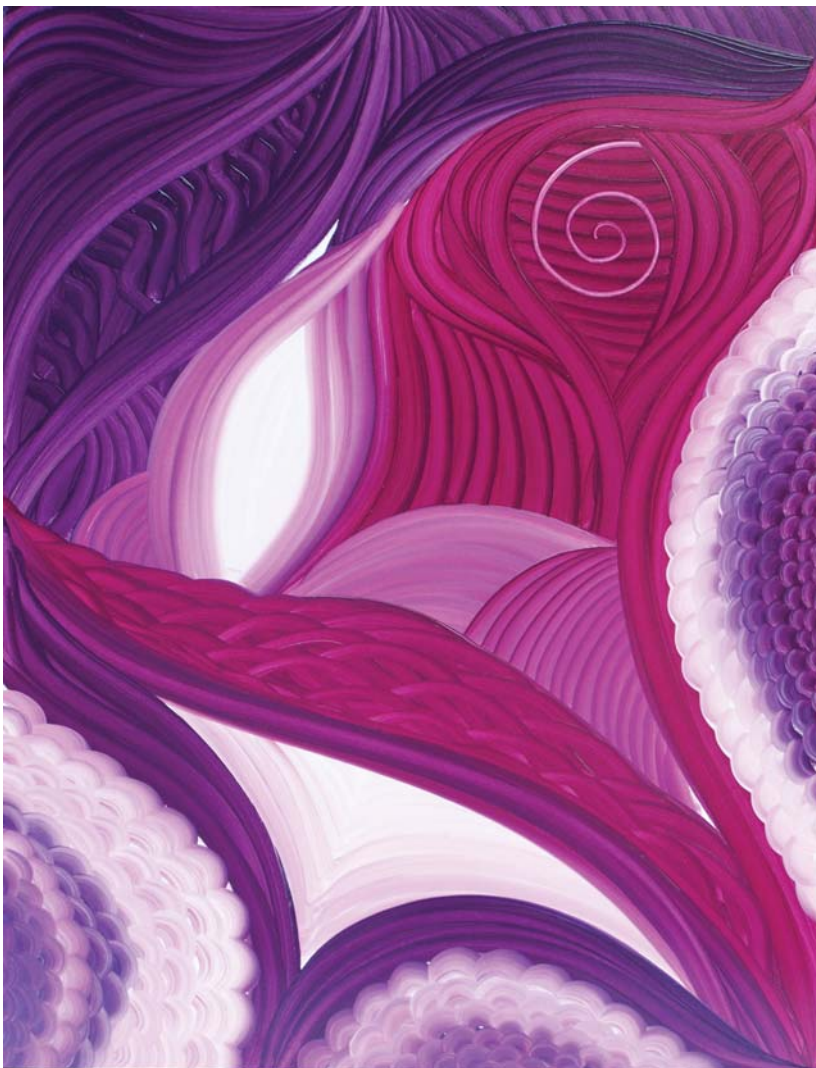
A Mira fényvalósága

Erősíti a szívet, a tüdőt és a légző rendszerünket. Átala, az értelem és az érzelmek kiegyenlítődik és harmonizálódik. Intenzív energiájával, biztosítja a teret körülöttünk, az ártó, alacsony rezgésektől, hatásoktól. Felruház minket külső-belső védelemmel, a hangolódás, az utazások és a meditációk során.