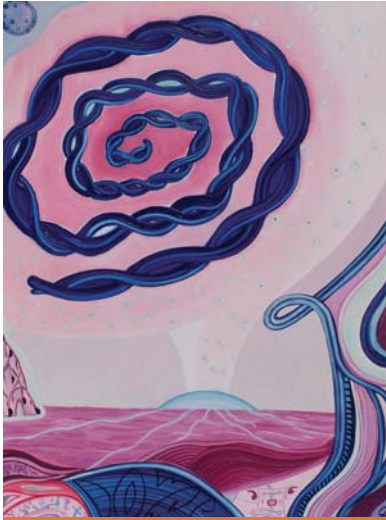
A DNS kettősspirál átalakulása

amikor azokban az órákban vagyok, mind belül és kívül is. Az egy leírhatatlan állapot. A légző gyakorlatok, a hangolódásban való belső érzékeléseim megnyitása és a folyamatos koncentráció, mind szükséges alaplépések a festés előtt. Minden alkalommal, különböző fénydimenziók csillagküldötteinek a jelenléte segíti a munkámat, hogy egy-egy festmény milyen szimbólumokat, csillagkódokat, szakrális formákat, üzeneteket vagy színárnyalatokat tartalmazzon. Ilyenkor nem én festek, csak a kezemben tartom az ecsetet. Tudom hihetetlen, de igaz. Ezért fogalmaztam úgy, hogy a festmények tudatos energia minőségek, mert nem én találok ki, hogy milyen színű legyen, és mit ábrázoljon. Én csak lefestem, amit érzek és megfestem, amit látok.