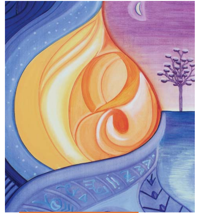
Az angyalok éneke

A Felsőbb Énünkhöz, a felsőbb valóságokhoz és a magasabb di-